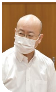
えんどう ひでき 遠藤英樹 議員