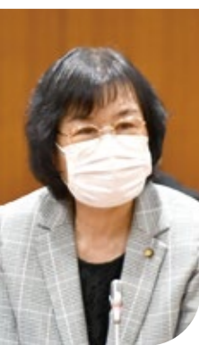
つちや えみこ 土屋英美子 議員